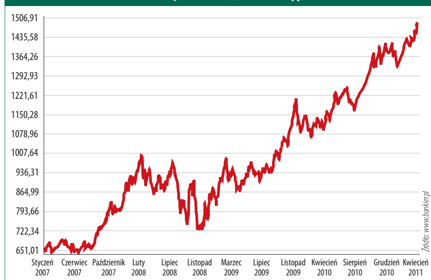
Złoto – wykres 5-letni (w USD za uncję)