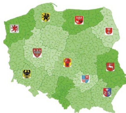
Regiony, w których planuje się uruchomienie JEREMIE

W ramach JEREMIE wydzielona część funduszy strukturalnych UE przeznaczonych na wsparcie finansowe na rzecz MŚP zostanie zamieniona na długookresową pomoc poprzez inżynierię finansową, a dokładnie oferowane w jej ramach instrumenty (kredyty, pożyczki, poręczenia, kapitał ryzyka etc.). Będą mogły one być używane w sposób ciągły i odnawialny (na bazie ich finansowego recydingu), zamiast zostać użyte tylko raz w formie grantu dla indywidualnych